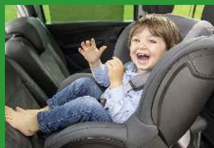
Автокресла групп I (для детей массой 9-18 кг)*